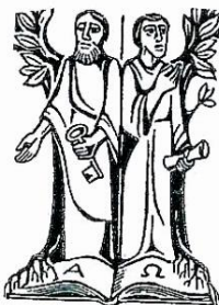
hll. Petrus u. Paulus

„Die Apostel baten den Herrn: Stärke unseren Glauben!“ (Lk 17,5)