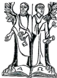
hll. Petrus u. Paulus