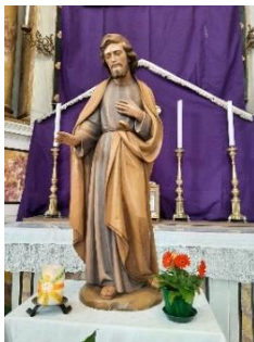
Heiliger Josef in der Pfarrkirche von Niederdorf

Hl. Josef, du Schutzpatron unseres Landes und Beschützer aller Familien, sei unser Fürsprecher bei Gott, unserem Vater, dass wir es mit Seiner Gnade schaffen, in guten Familien zu leben und einander in Treue Stütze und Halt zu sein.