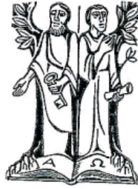
hll. Petrus u. Paulus